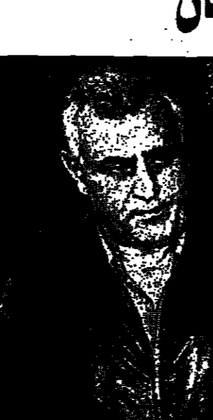
وزير الدفاع الاسرائيلي اسحق موردياي ورئيس لركان الجيش شاولون موزلا يتفقدان قائمة عسكرية على الحدود مع لبنان